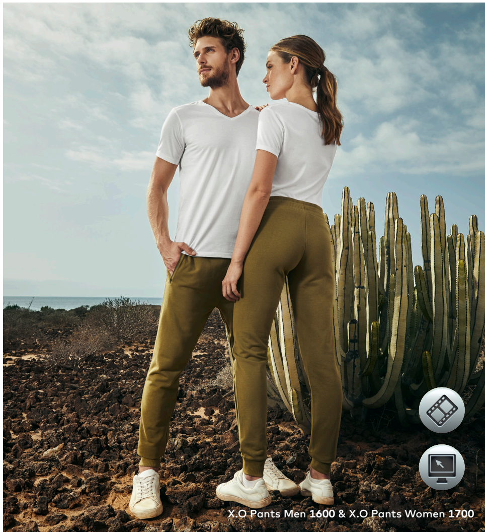
X.O Pants Men 1600 & X.O Pants Women 1700

Einzigartige Molton-Mischgewebe-Sweatpants, unbrushed, Bund mit Kordelzug, 2 Seitentaschen mit coated Ton-in-Ton Reißverschluss, Elasthanbündchen am Bund und Beinabschluss, hergestellt aus langstapeliger gekämmter Baumwolle und Polyester. Die besonders glatte Oberfläche und der weich fallende Stoff verleihen der Sweatpants ein einzigartiges, elastisches und seidiges Finish. Die Sweatpants ist schmal geschnitten.