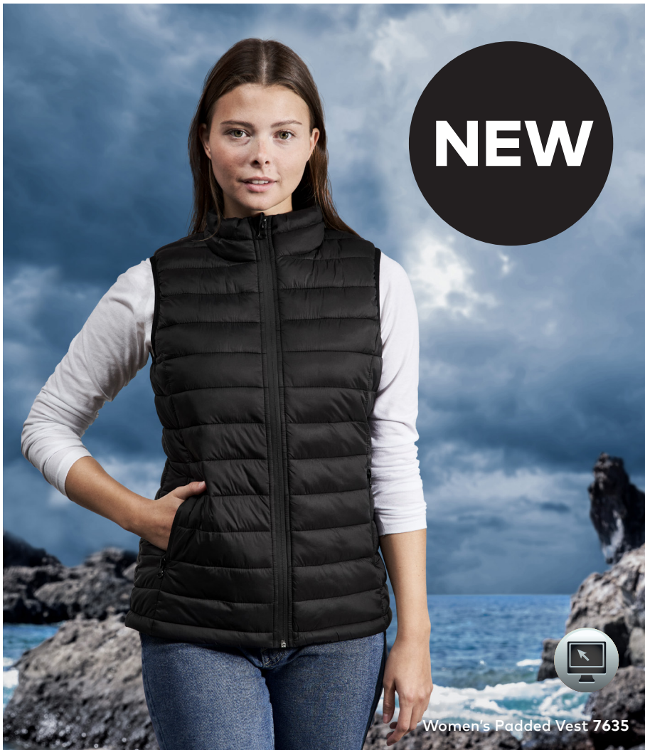
Women's Padded Vest 7635