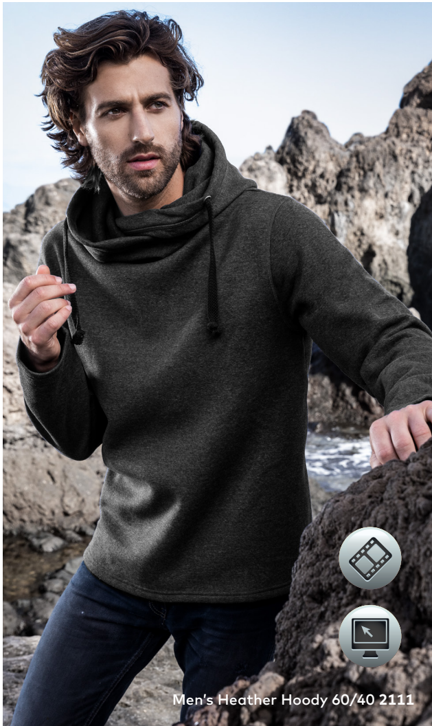
Men's Heather Hoody 60/40 2111