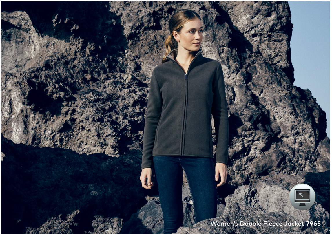
Women's Double Fleece Jacket 7965

Double-Fleecejacke mit Stehkragen und durchgehendem verdecktem Reißverschluss, Elasthanbündchen an Ärmeln sowie 2 Seitentaschen mit Reißverschluss. Die Innenseite der Jacke ist in Kontrastfarbe, hergestellt aus Polyester mit beidseitiger Anti-Pilling-Ausrüstung. Die Fleecejacke ist schmal geschnitten.