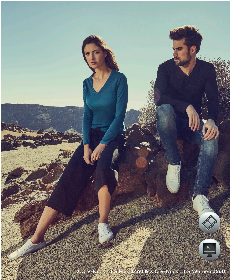
X.O V-Neck T LS Men 1460 &amp; X.O V-Neck T LS Women 1560