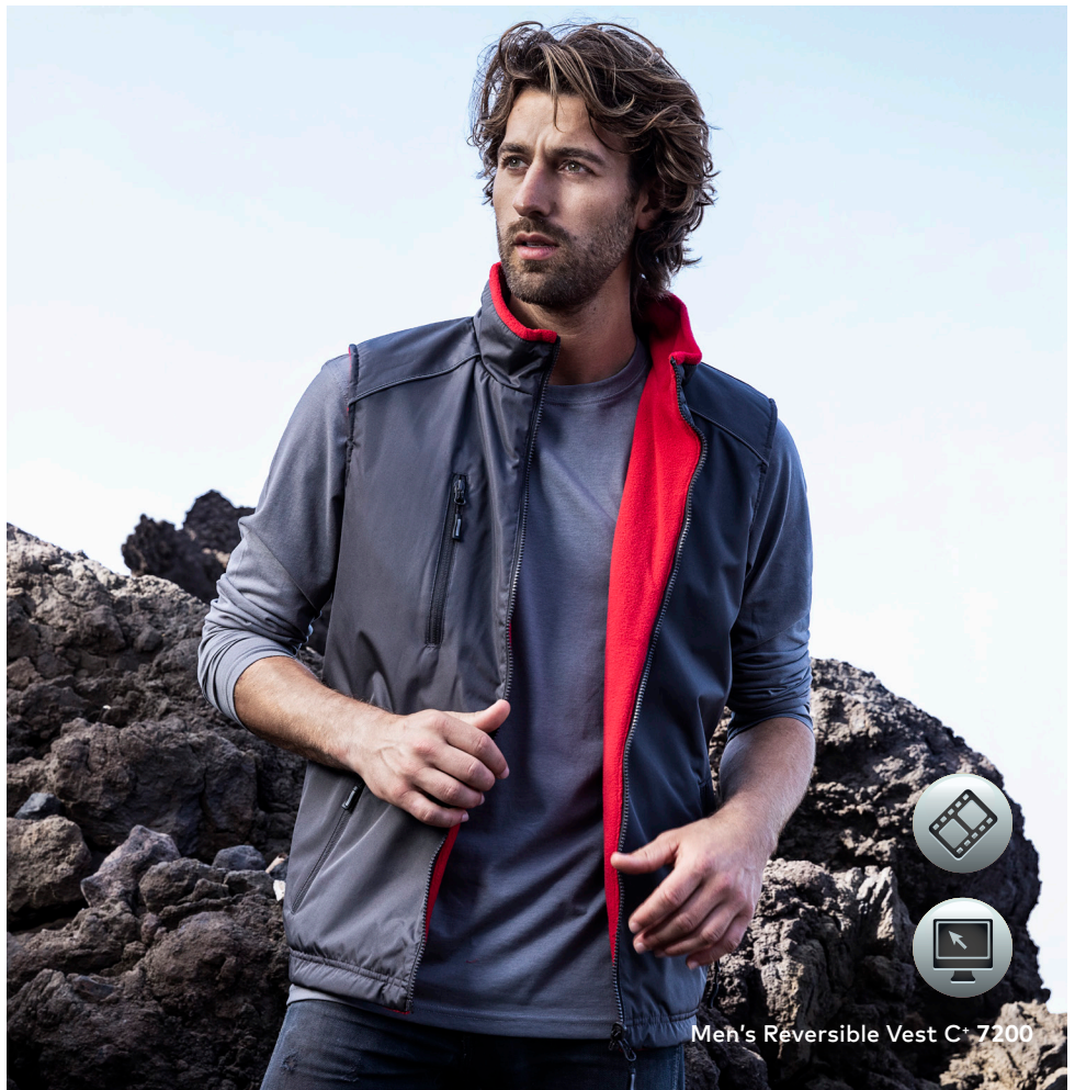
Men's Reversible Vest C+ 7200

Wendeweste, die besonderen Merkmale dieser Jacke: Stehkragen, Napoleontasche auf der Vorderseite, 2 Seitentaschen mit RV auf der Vorder-/Innenseite, eingenähter Schlüsselanhänger in Seitentasche, reflektierende Paspeln und RV Anhänger, Tunnelzug am Saum mit Kordelstopper, abgerundeter Saum, Invisible Zip zum Veredeln, Fixierung für Außenjacke, Fleece Innenseite mit Anti-Pilling Ausrüstung, hergestellt aus 100% Polyester. Die Weste ist modern geschnitten. Jacken Konzept 6-in-1, kombinierbar mit Außenjacke 7548/7549.