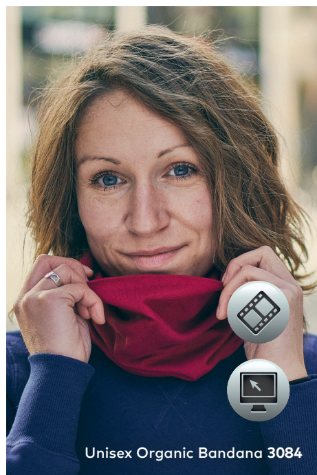
Unisex Organic Bandana 3084

Single-Jersey-Bandana, 2-lagig, hergestellt aus langstapeliger gekämmter zertifizierter (Bio-) Baumwolle mit Elasthananteil für Formbeständigkeit und Bewegungsfreiheit. Das Bandana ist mit Seitennähten gefertigt und bietet unterschiedliche Tragevarianten. Maße: S (Kind) ca. 24 × 23 cm, L (Erw.) ca. 26 × 25 cm. Die Bandanas sind vom Umtausch ausgeschlossen.