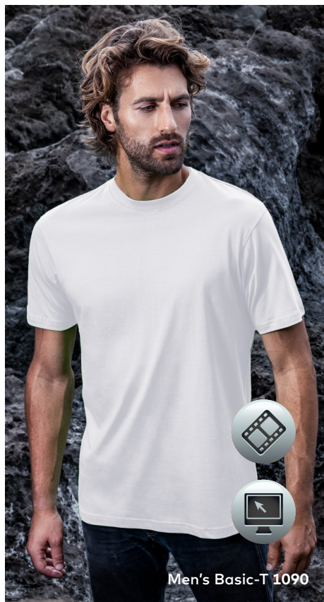
Men's Basic-T 1090

Zeitloses Single-Jersey-T-Shirt mit Elasthananteil im Rippbündchen, hergestellt aus gekämmter Baumwolle. Das T-Shirt ist klassisch geschnitten und aus Schlauchware gefertigt.