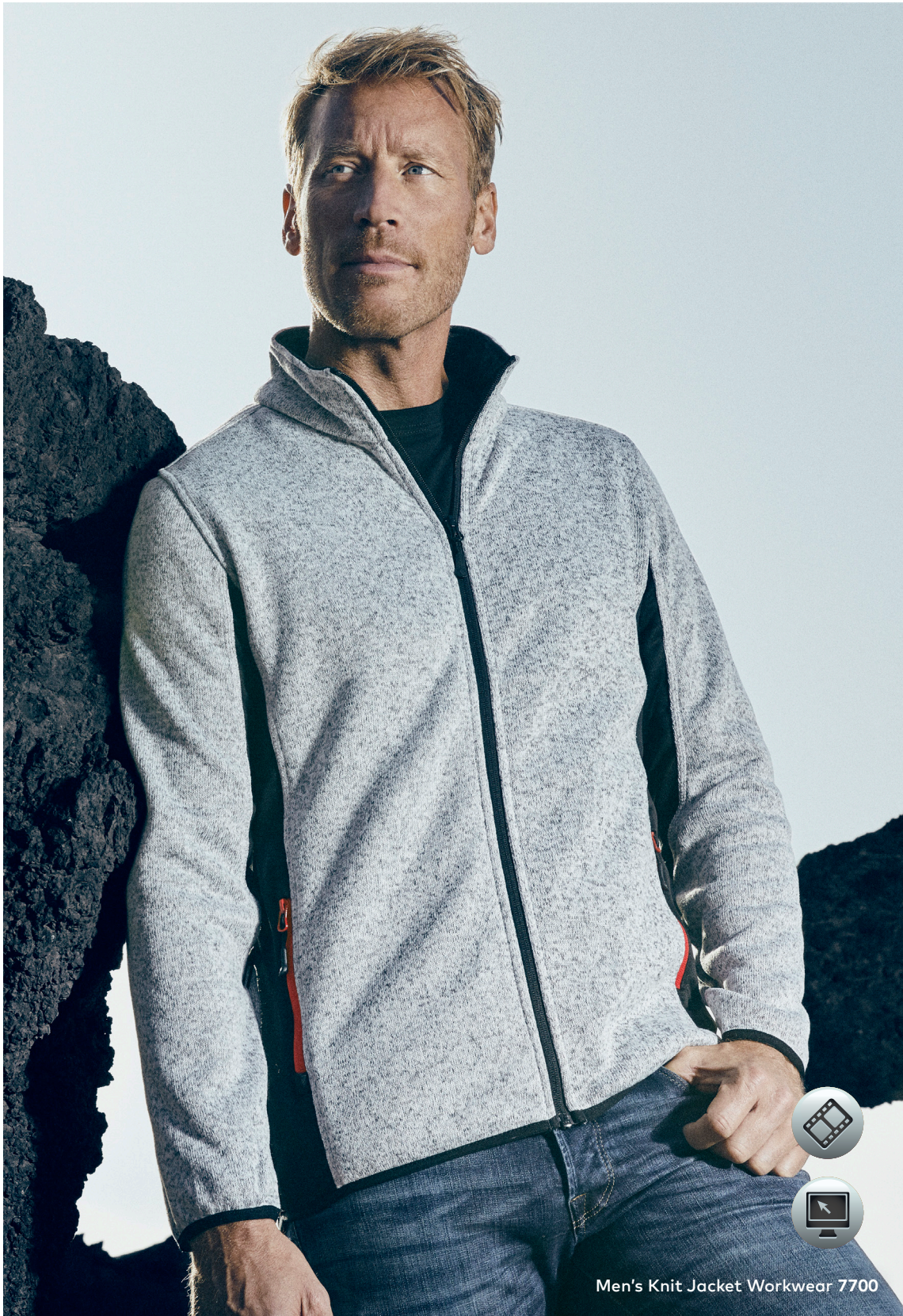
Men's Knit Jacket Workwear 7700