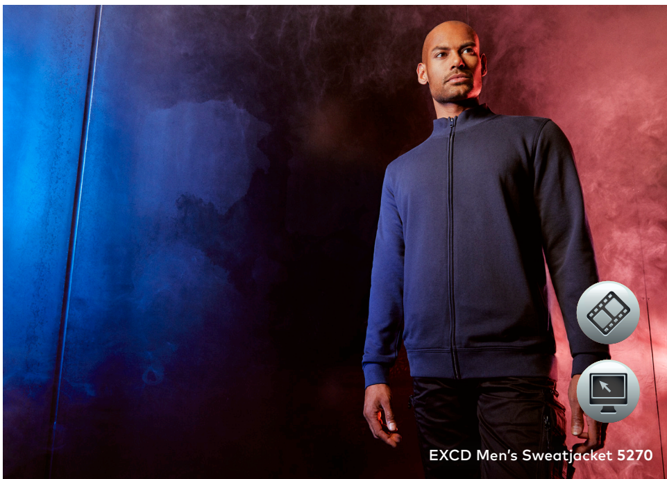
EXCD Men's Sweatjacket 5270