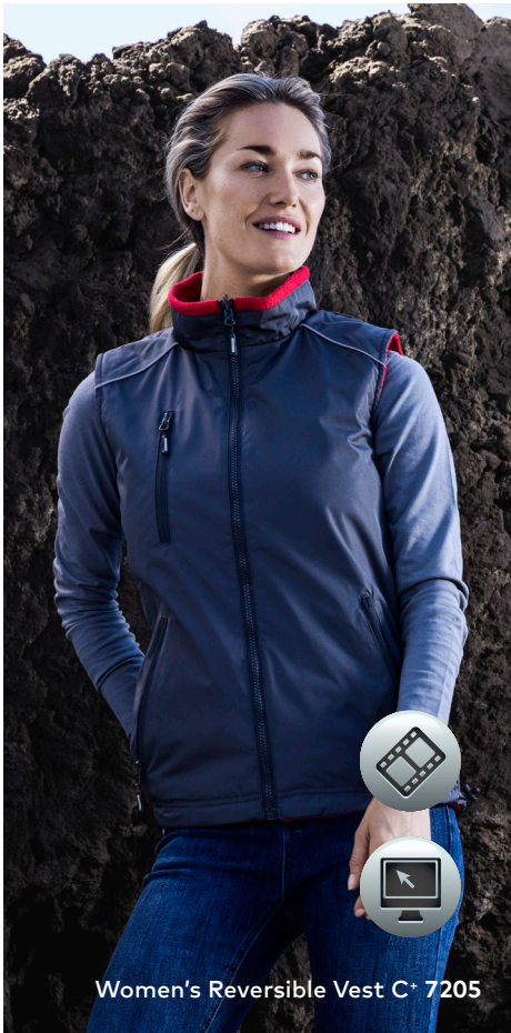
Women's Reversible Vest C+ 7205