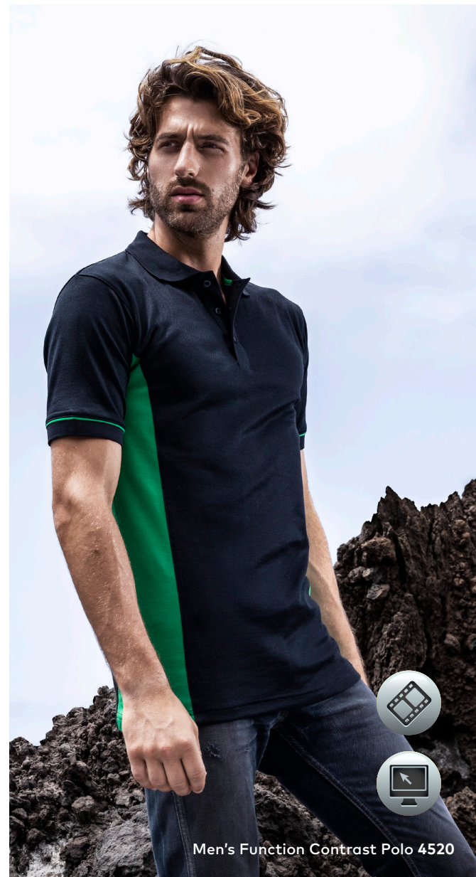
Men's Function Contrast Polo 4520

Funktions-Mischgewebe-Interlock-Polo in Piqué Optik mit Knopfleiste und 3 Knöpfen Ton in Ton, Ärmelbündchen mit Paspel sowie Seiteneinsatz in Kontrastfarbe und seitliche Schlitz, die besonderen Merkmale dieses Polos: hautsympathisch, schnelltrocknend, schweißabsorbierend, hergestellt aus gekämmter Baumwolle innen und Polyester außen. Das Polo ist modern geschnitten.