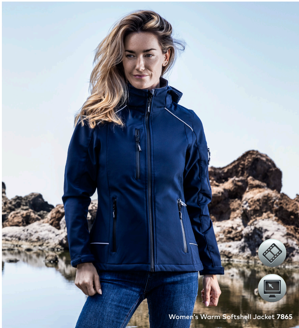
Women's Warm Softshell Jacket 7865