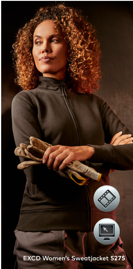
EXCD Women's Sweatjacket 5275