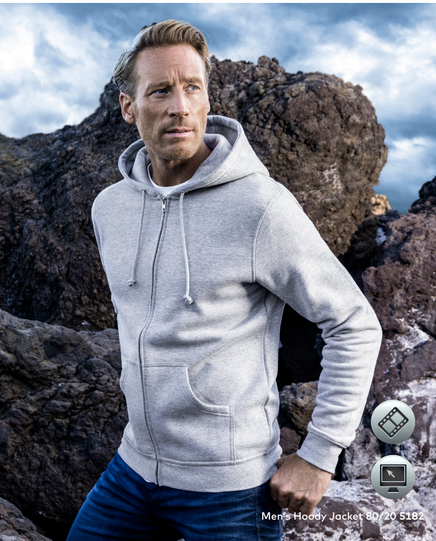
Men's Hoody Jacket 80/20 5182