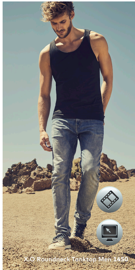
X.O Roundneck Tanktop Men 1450

Einzigartiges Single-Jersey Tank Top mit Self-Fabric Kragen, hergestellt aus langstapeliger gekämmter Baumwolle. Die besonders glatte Oberfläche und der weich fallende Stoff verleihen dem Shirt ein einzigartiges, elastisches und seidiges Finish. Das T-Shirt ist schmal geschnitten und mit Seitennähten gefertigt.