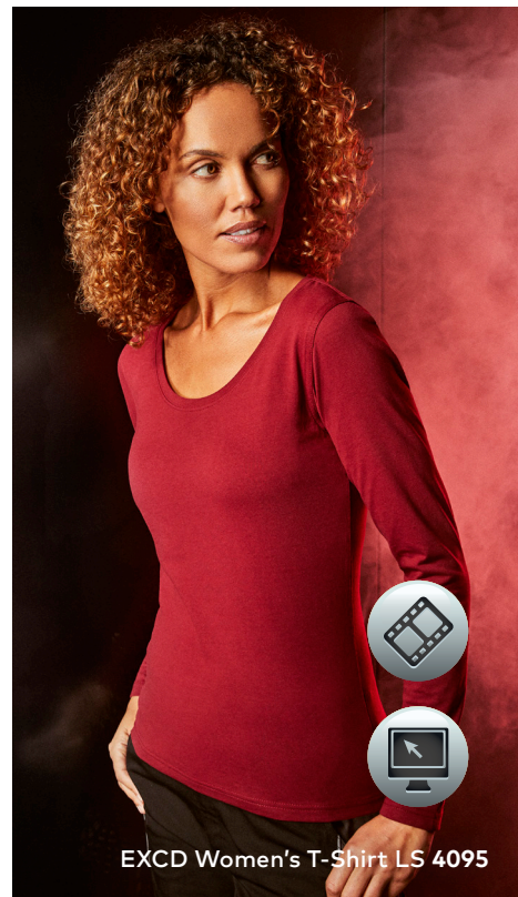
EXCD Women's T-Shirt LS 4095

Langarm-Workwear-Single-Jersey-Mischgewebe-T-Shirt mit femininem Ausschnitt bei Women und Elasthananteil im schmalen Rippbündchen, Schlaufen in der Seitennaht innen, hergestellt aus langstapeliger Baumwolle und Polyester mit der VORTEX® Spinning Technology. Die extrem glatte Oberfläche ist pillingresistent und hervorragend geeignet für jegliche Art der Veredelung. Verstärkte Schulter- und Doppelnähte sowie ein Nackenband vervollständigen dieses Produkt. EXCD überzeugt durch überdurchschnittlich langlebige Qualität, minimale Einlaufwerte und ist besonders pflegeleicht. Das EXCD Langarm-T-Shirt hat eine optimale Passform, und ist mit Seitennähten gefertigt. Dank des hohen Baumwollanteils bietet es maximalen Tragekomfort, für Industrierwäsche geeignet, getestet nach ISO 15797.