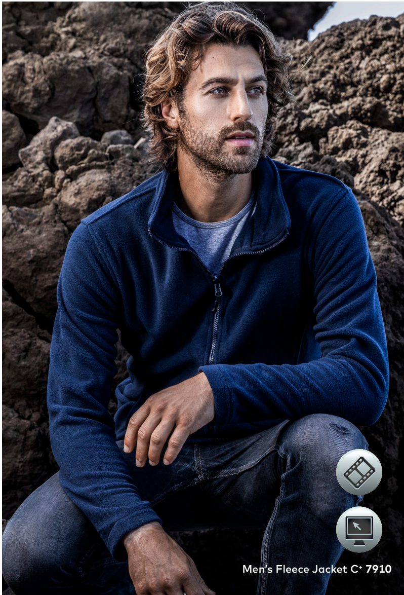
Men's Fleece Jacket C + 7910