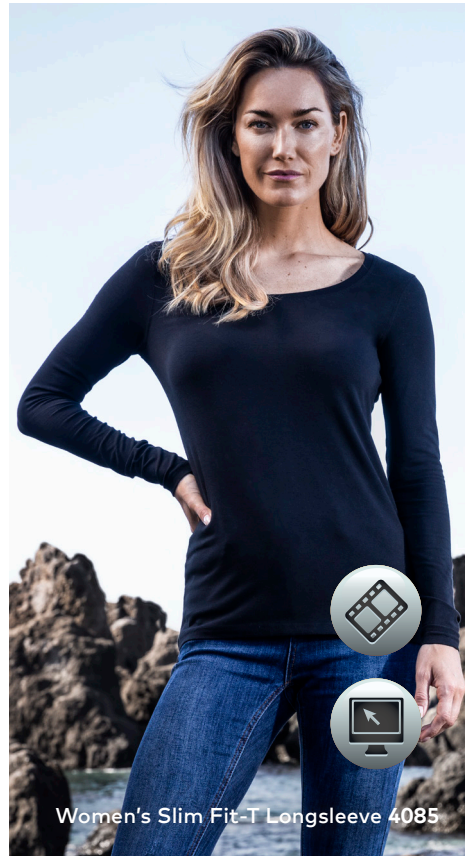
Women's Slim Fit-T Longsleeve 4085

Modernes Single-Jersey-Langarmshirt mit Elasthananteil im Rippbündchen, mit weitem Rundhalsausschnitt, hergestellt aus gekämmter Baumwolle mit Elasthananteil für mehr Bewegungsfreiheit. Das Langarmshirt ist eng anliegend geschnitten und mit Seitennähten gefertigt.