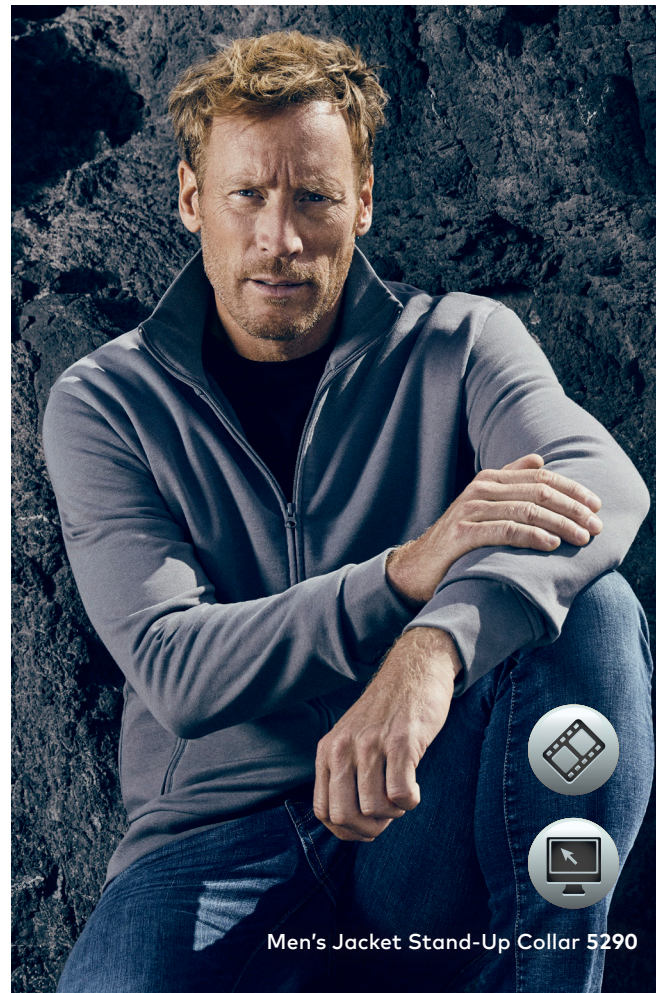
Men's Jacket Stand-Up Collar 5290

Klassische Molton-Sweatjacke mit angerauter Innenseite und Elasthanbündchen an Ärmeln und Saum, Stehkragen, durchgehendem, verdecktem Ton in Ton-Reißverschluss sowie 2 Seitentaschen mit Reißverschluss, hergestellt aus gekämmter Baumwolle. Die Sweatjacke ist modern geschnitten.