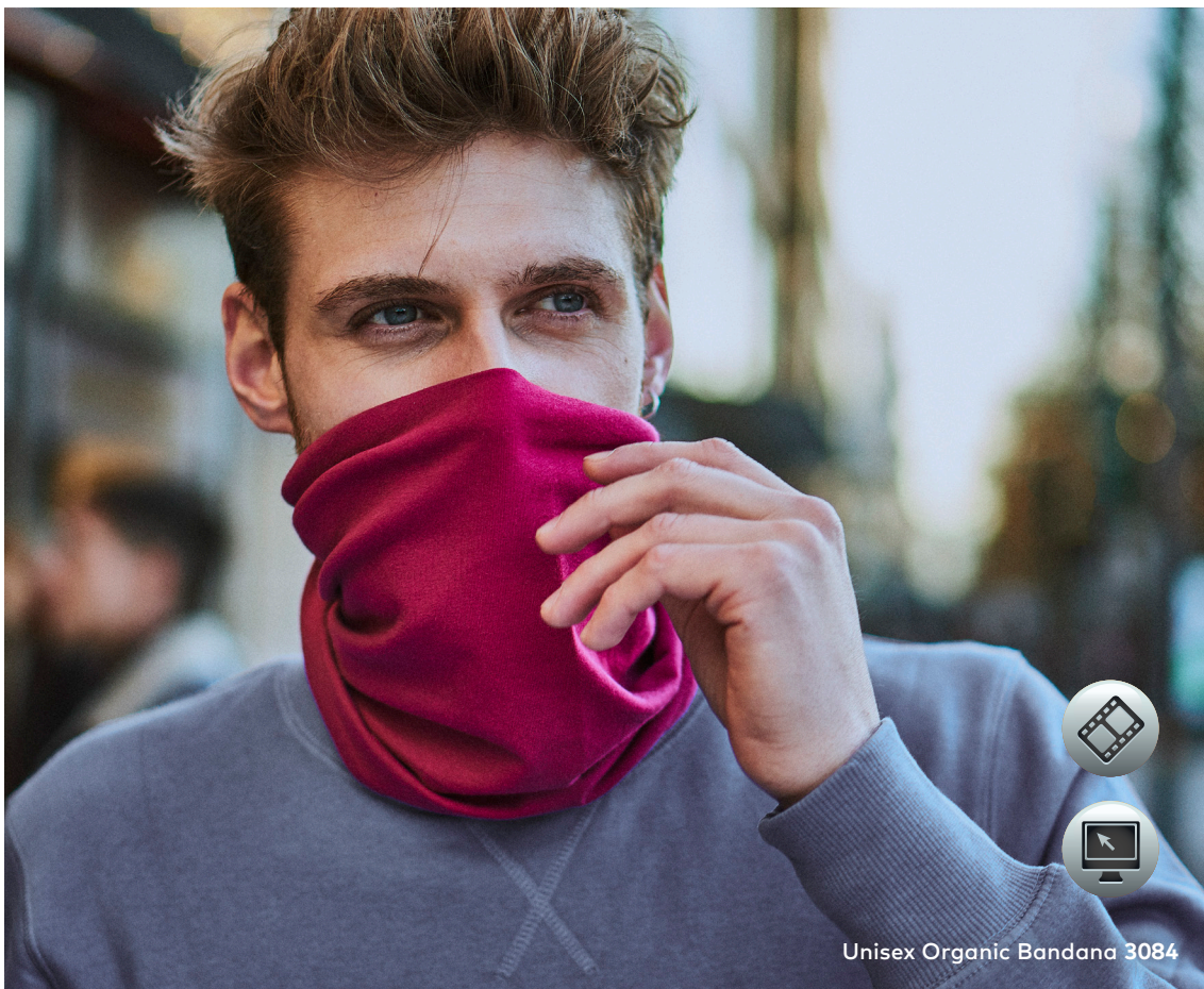
Unisex Organic Bandana 3084