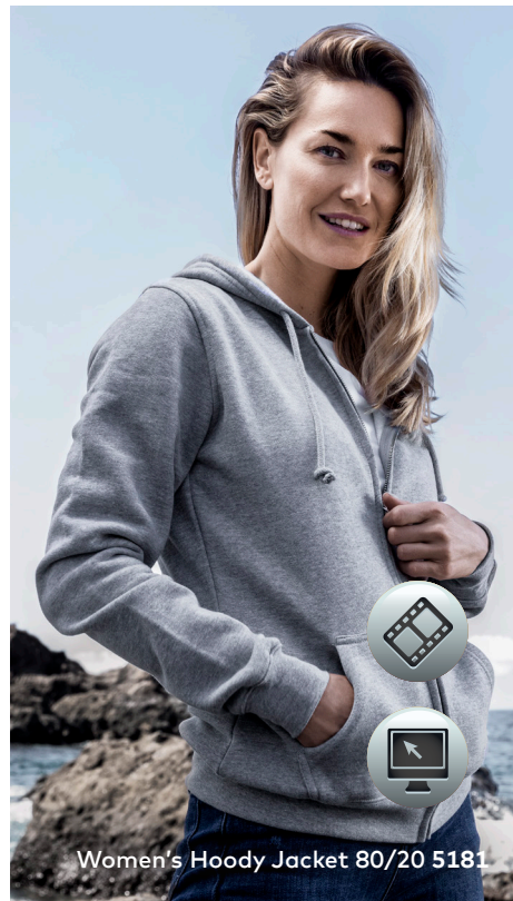
Women's Hoody Jacket 80/20 5181

Klassische Molton-Mischgewebe-Kapuzensweatjacke mit angerauter Innenseite und Elasthanbündchen an Ärmeln und Saum sowie einer Kängurutasche, Doppelkapuze und durchgehendem, verdecktem nickelfreiem Metallreißverschluss, hergestellt aus gekämmter Baumwolle und Polyester. Die Kapuzensweatjacke ist modern geschnitten.