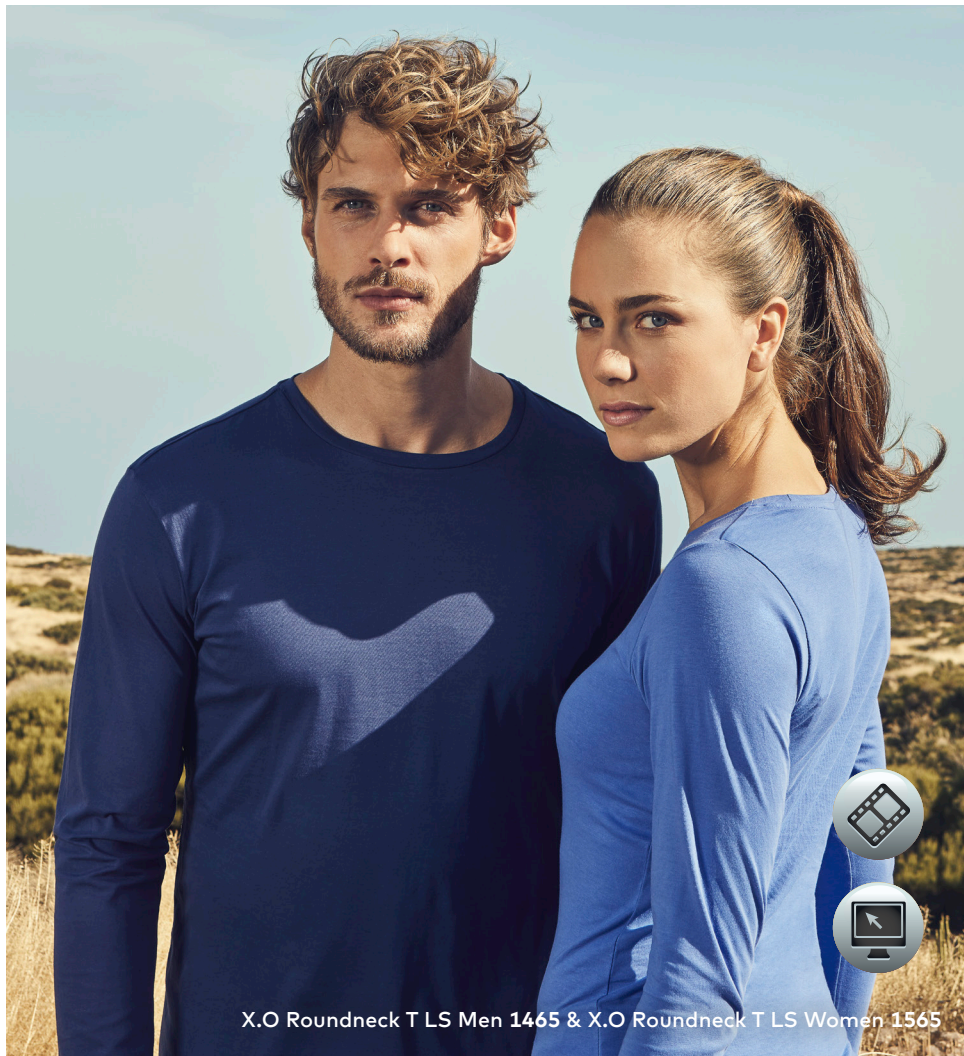
X.O Roundneck T LS Men 1465 & X.O Roundneck T LS Women 1565

Einzigartiges Single-Jersey Langarmshirt mit Self-Fabric Kragen, hergestellt aus langstapeliger gekämmter Baumwolle. Die besonders glatte Oberfläche und der weich fallende Stoff verleihen dem Shirt ein einzigartiges, elastisches und seidiges Finish. Das T-Shirt ist schmal geschnitten und mit Seitennähten gefertigt.