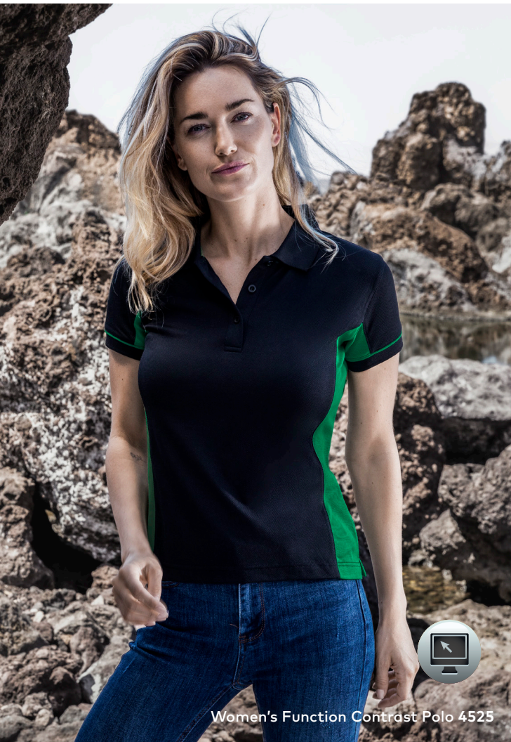
Women's Function Contrast Polo 4525