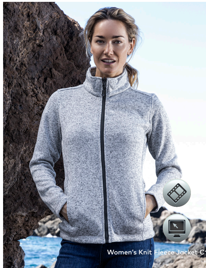
Women's Knit Fleece Jacket C+

Strickfleece-Jacke mit Stehkragen und angerauter Innenseite, durchgehender Reißverschluss in Kontrastfarbe und 2 Seitentaschen auf der Vorderseite sowie Fixierung für Außenjacke, hergestellt aus Polyester. Die Jacke ist schmal geschnitten. Jacken Konzept 6-in-1, kombinierbar mit Außenjacke 7548/7549.