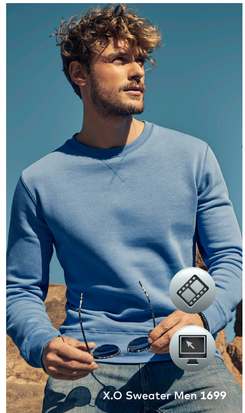
X.O Sweater Men 1699

Einzigartiges Molton-Mischgewebe-Sweatshirt mit angerauter Innenseite, Flatlock-Nähten und Elasthanbündchen an Hals, Ärmeln und Saum, hergestellt aus langstapeliger gekämmter Baumwolle und Polyester. Die besonders glatte Oberfläche und der weich fallende Stoff verleihen dem Sweatshirt ein einzigartiges, elastisches und seidiges Finish. Das Sweatshirt ist schmal geschnitten.