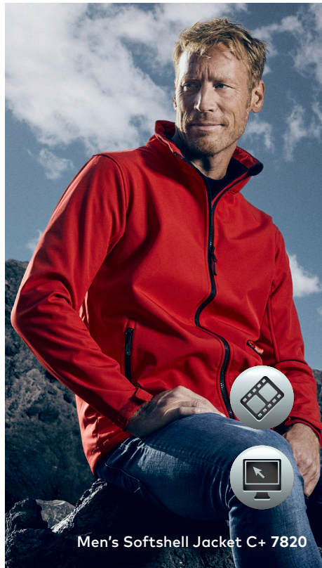
Men's Softshell Jacket C+ 7820

Softshelljacke, die besonderen Merkmale dieser Jacke: Reißverschluss mit Regen- und Kinnschutz, verstellbare Armabschlüsse mit Klettverschlüssen, Tunnelzug am Saum mit Kordelstopper innen, 2 Seitentaschen mit Reißverschluss, Fixierung für Außenjacke, atmungsaktiv, wasserdicht 8.000 mm, hergestellt aus bi-elastischem Bonded-Fleece aus Polyester mit Elasthananteil für mehr Bewegungsfreiheit. Die Jacke ist sportlich geschnitten. Jacken Konzept 6-in-1, kombinierbar mit Außenjacke 7548/7549.