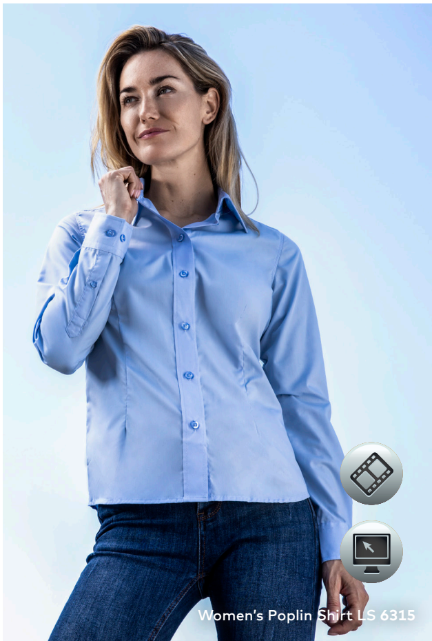
Women's Poplin Shirt LS 6315