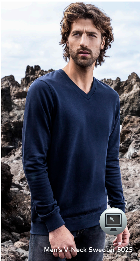
Men's V-Neck Sweater 5025