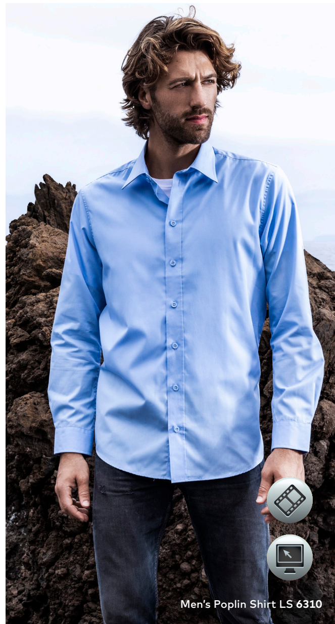
Men's Poplin Shirt LS 6310

Klassisches Popeline-Langarm-Mischgewebe-Hemd mit verstärktem Kent-Kragen und Knopfleiste mit Knöpfen Ton in Ton sowie separater Brusttasche und Ersatzknöpfen. Die besonderen Merkmale dieses Hemdes: pflegeleichtes Mischgewebe, Abnäher vorne und hinten für Women, verstellbare 2-Knopf-Manschette (Sportmanschette), lange Ärmelschlitze mit Knopf, doppelte Rückenpasse, abgerundeter Saum, hergestellt aus Baumwolle mit Polyester. Das Hemd hat einen modernen Schnitt. Klassisch einzeln verpackt.