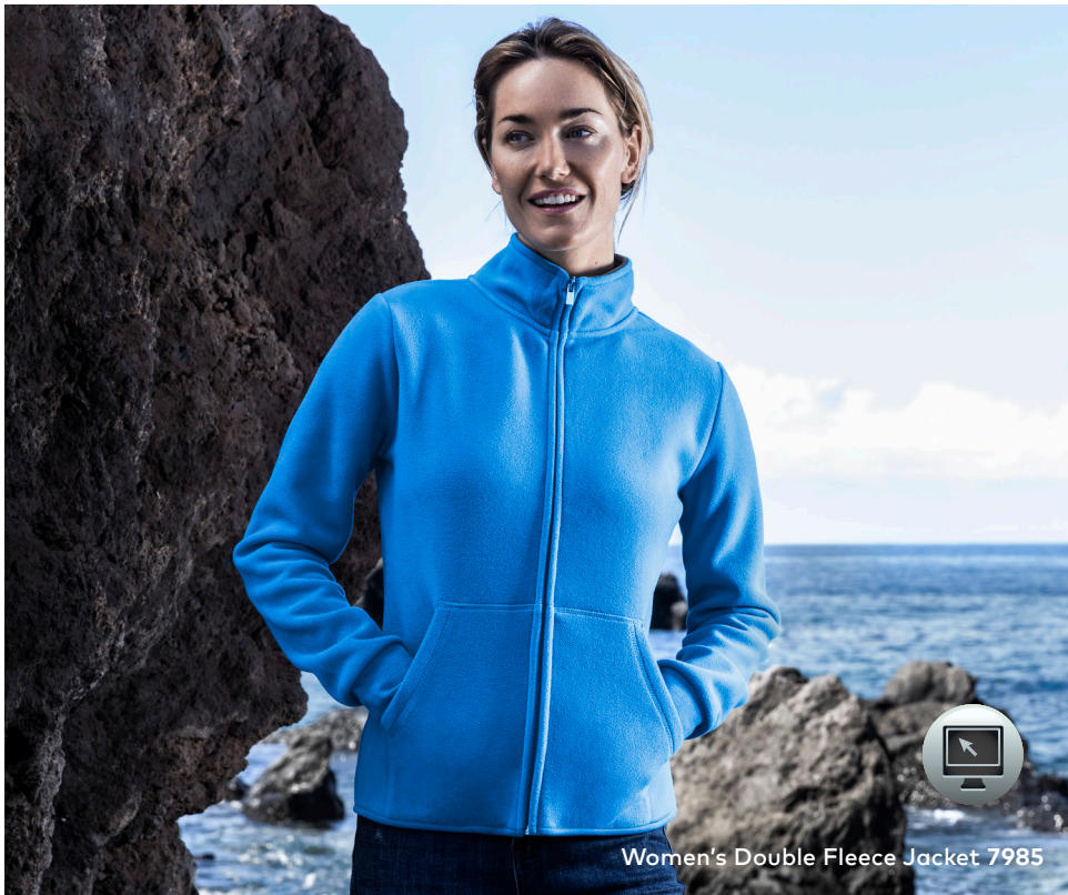
Women's Double Fleece Jacket 7985

Double-Fleecejacke mit Stehkragen und durchgehendem verdecktem Reißverschluss, Elasthanbündchen an Ärmeln sowie Einschubtaschen mit Ziernaht. Die Innenseite der Jacke ist in Kontrastfarbe, hergestellt aus Polyester mit beidseitiger Anti-Pilling-Ausrüstung. Die Fleecejacke ist schmal geschnitten.