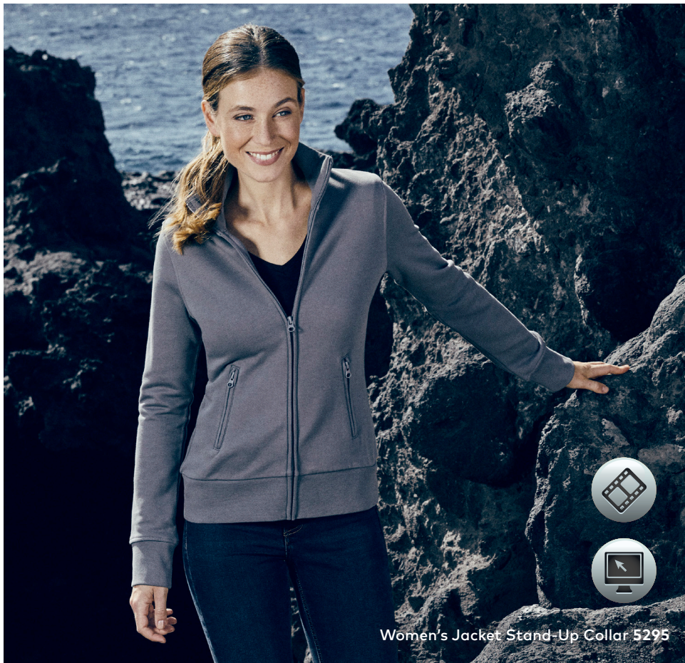
Women's Jacket Stand-Up Collar 5295