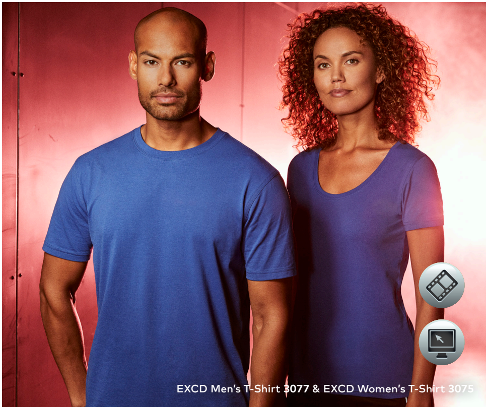
EXCD Men's T-Shirt 3077 & EXCD Women's T-Shirt 3075