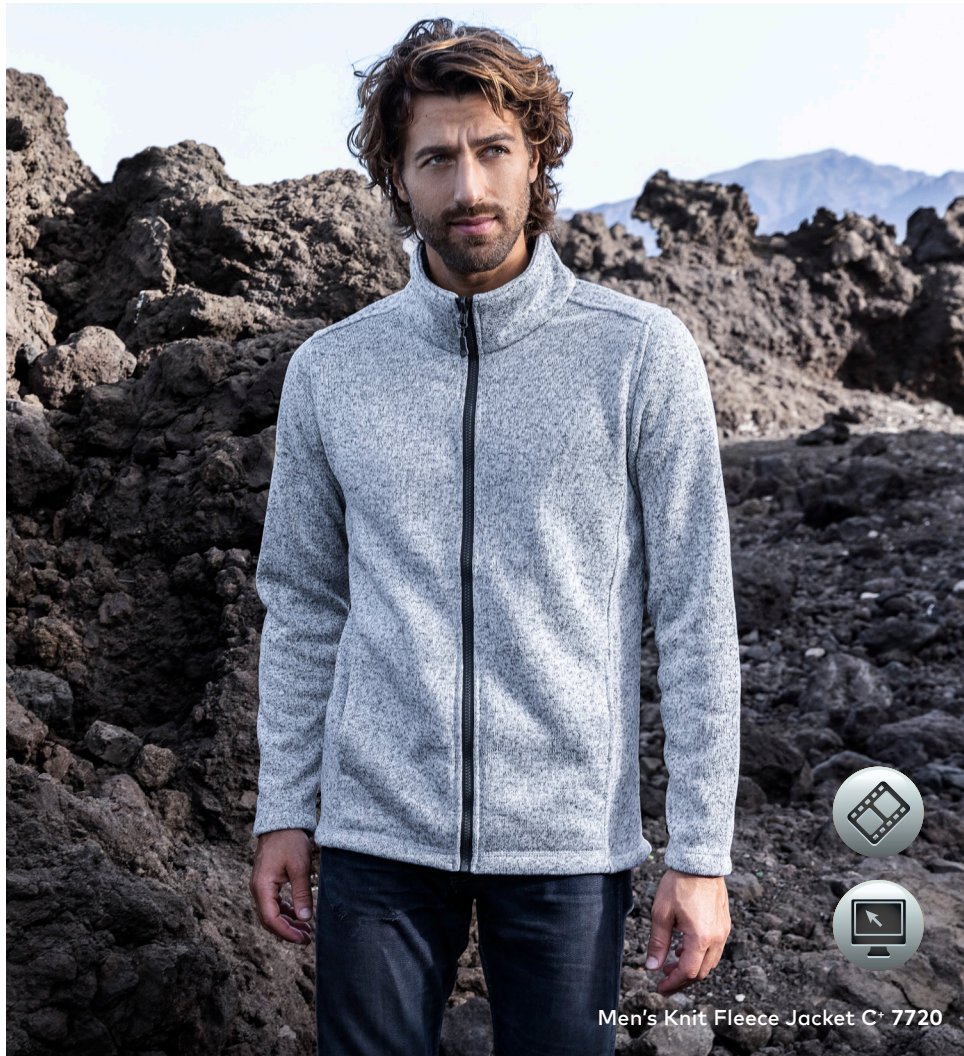
Men's Knit Fleece Jacket C+ 7720