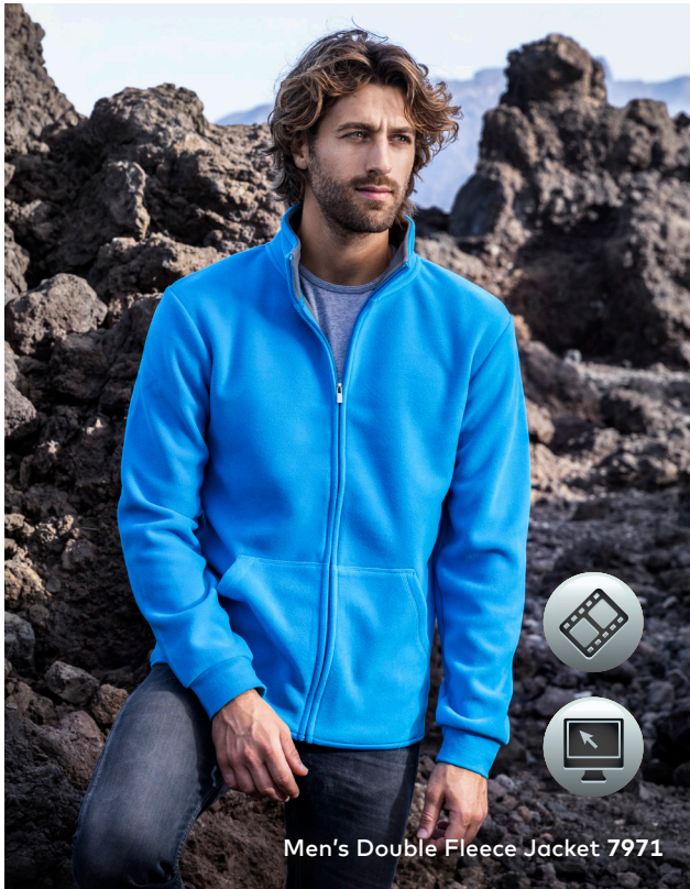
Men's Double Fleece Jacket 7971