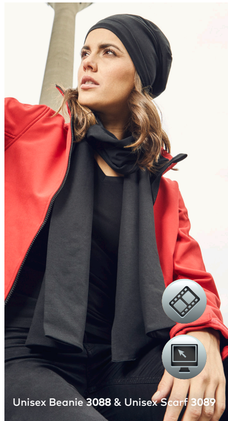
Unisex Beanie 3088 &amp; Unisex Scarf 3089

Unisex-Single-Jersey-Beanie, doppellagig, Tear-Off-Label zum einfachen Heraustrennen. Unisex-Single-Jersey-Schal, doppellagig, Maße 180 cm × 30 cm, Tear-Off-Label zum einfachen Heraustrennen, hergestellt aus gekämmter Baumwolle mit Elasthananteil für Formbeständigkeit.