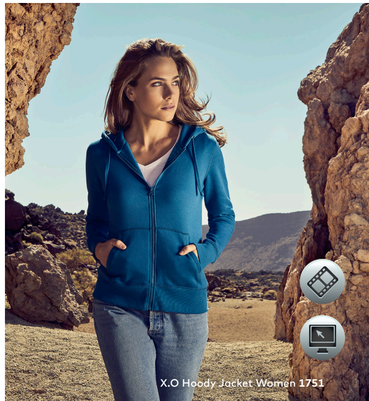
X.O Hoody Jacket Women 1751

Einzigartiges Molton-Mischgewebe-Kapuzensweatjacke mit angerauter Innenseite, Kängurutasche und Elasthanbündchen an Hals, Ärmeln und Saum, hergestellt aus langstapeliger gekämmter Baumwolle und Polyester. Die besonders glatte Oberfläche und der weich fallende Stoff verleihen der Sweatjacke ein einzigartiges, elastisches und seidiges Finish. Das Sweatshirt ist schmal geschnitten.