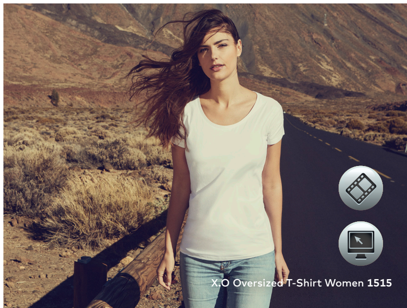
X.O Oversized T-Shirt Women 1515