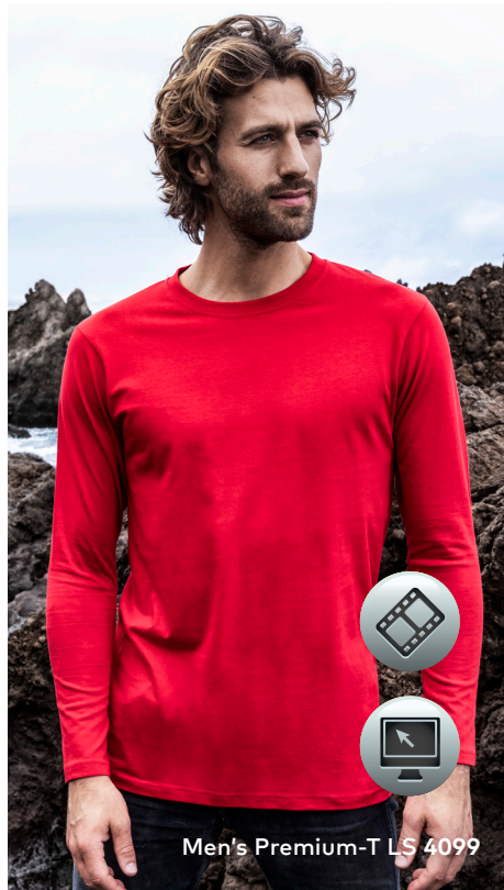
Men's Premium-T LS 4099

Klassisches Single-Jersey-Langarmshirt mit Elasthananteil im schmalen Rippbündchen, hergestellt aus langstapeliger gekämmter Baumwolle, die besonders feine Oberfläche ist hervorragend geeignet für jegliche Art der Veredelung. Das Langarmshirt ist modern geschnitten und aus Schlauchware gefertigt.