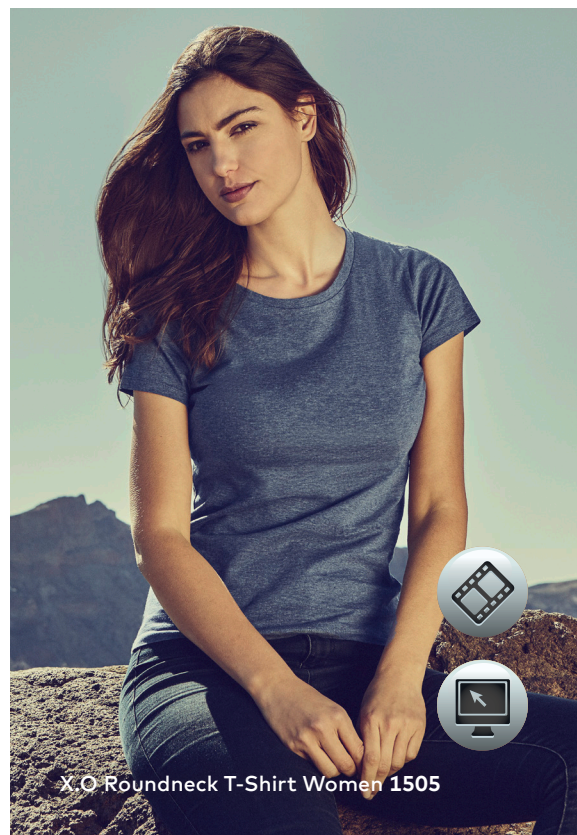
X.O Roundneck T-Shirt Women 1505

Einzigartiges Single-Jersey T-Shirt mit Self-Fabric Kragen, hergestellt aus langstapeliger gekämmter Baumwolle. Die besonders glatte Oberfläche und der weich fallende Stoff verleihen dem Shirt ein einzigartiges, elastisches und seidiges Finish. Das T-Shirt ist schmal geschnitten und mit Seitennähten gefertigt.