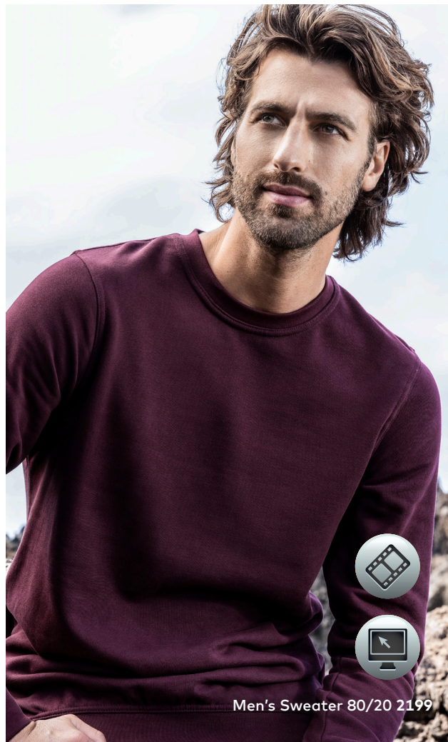
Men's Sweater 80/20 2199

Klassisches Molton-Mischgewebe-Sweatshirt mit angerauter Innenseite und Elasthanbündchen an Hals, Ärmeln und Saum, hergestellt aus gekämmter Baumwolle und Polyester. Das Sweatshirt ist modern geschnitten.