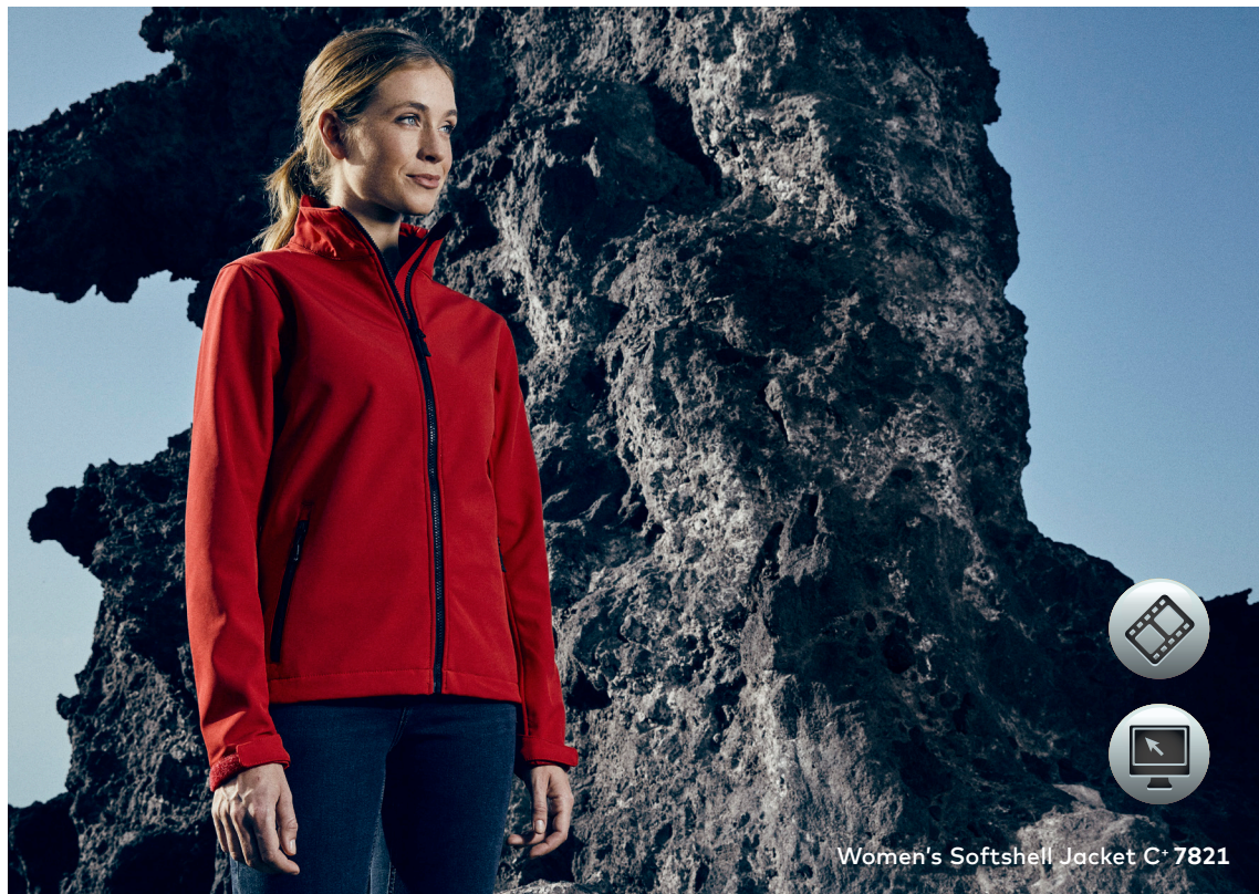
Women's Softshell Jacket C 7821