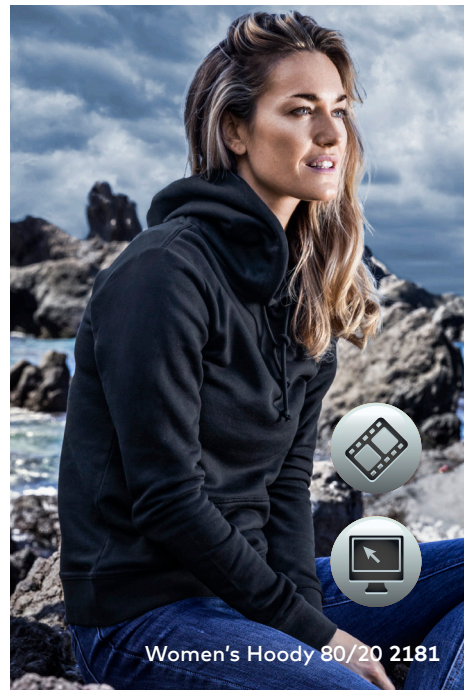
Women's Hoody 80/20 2181

Klassisches Molton-Mischgewebe-Kapuzensweatshirt mit angerauter Innenseite und Elasthanbündchen an Ärmeln und Saum sowie einer Kängurutasche, Doppelkapuze, hergestellt aus gekämmter Baumwolle und Polyester. Das Kapuzensweatshirt ist modern geschnitten.