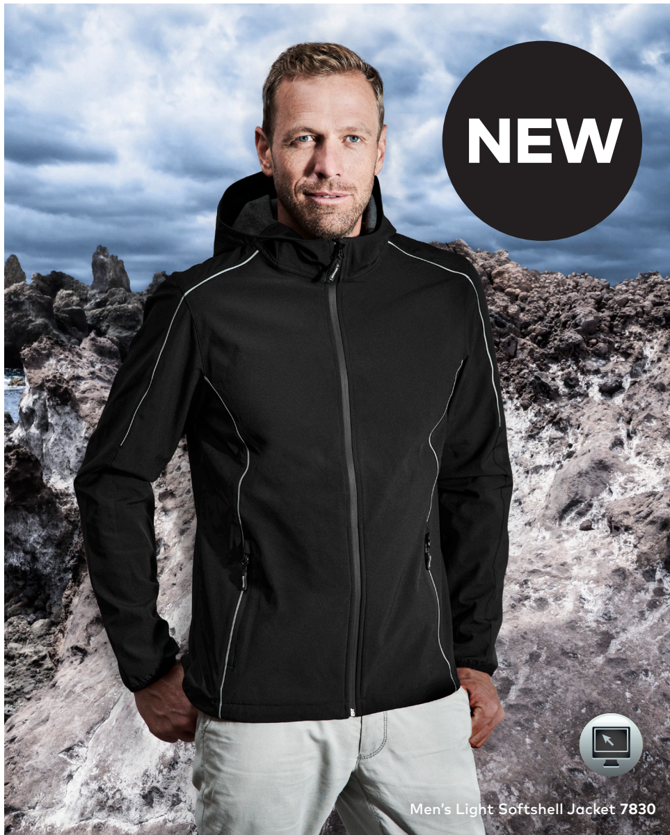
Men's Light Softshell Jacket 7830