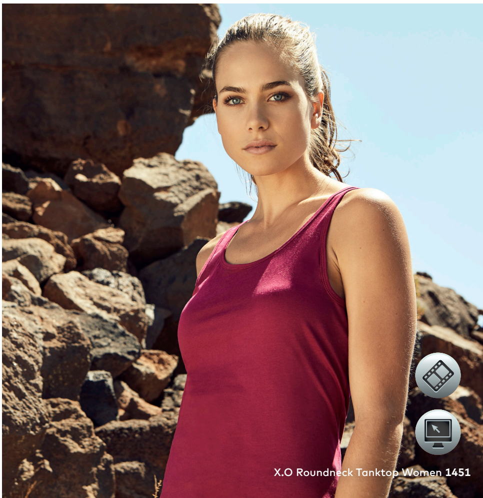
X.O Roundneck Tanktop Women 1451