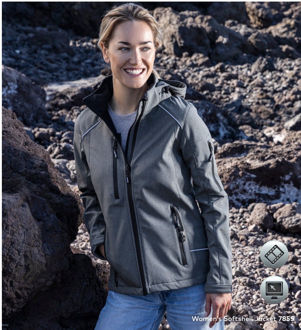
Women's Softshell Jacket 7855