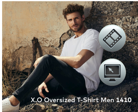
X.O Oversized T-Shirt Men 1410

Einzigartiges Oversized Single-Jersey T-Shirt mit Self-Fabric Kragen, hergestellt aus langstapeliger gekämmter Baumwolle. Die besonders glatte Oberfläche und der weich fallende Stoff verleihen dem Shirt ein einzigartiges, elastisches und seidiges Finish. Das T-Shirt ist oversized geschnitten und mit Seitennähten gefertigt.